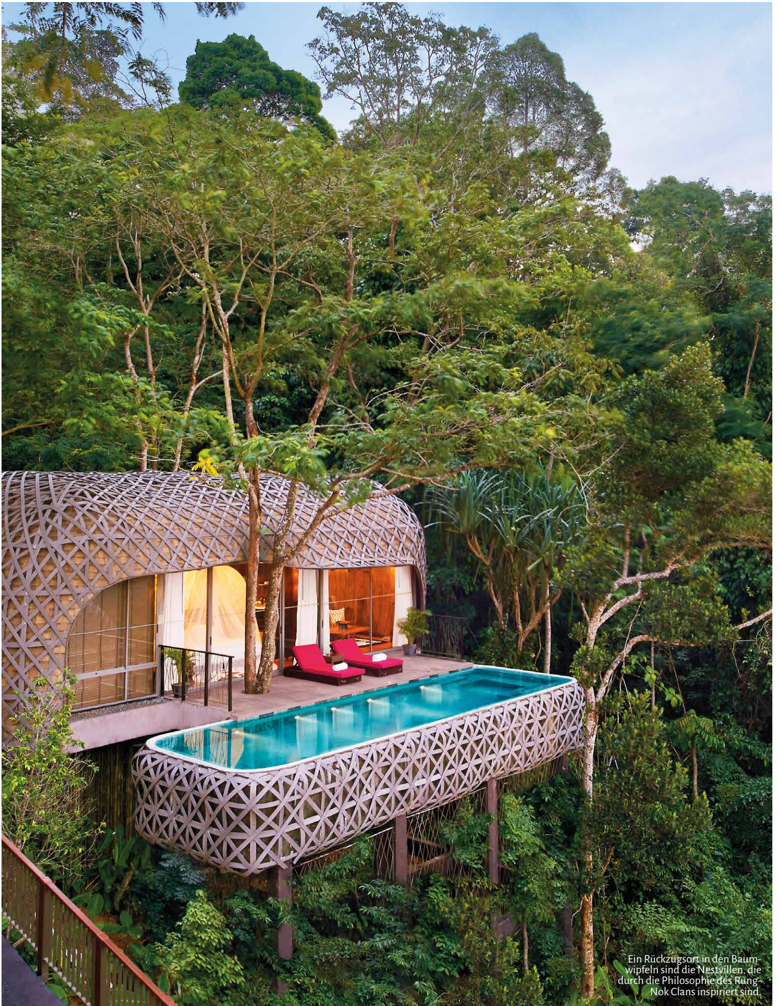
Ein Rückzugsort in den Baumwipfeln sind die Nestvillen, die durch die Philosophie des Rung-Nok Clans inspiriert sind.