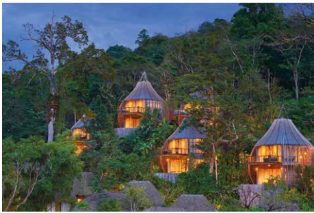
Die Baumhausvillen ermöglichen einen sagenhaften Blick über den Regenwald auf den Ozean.