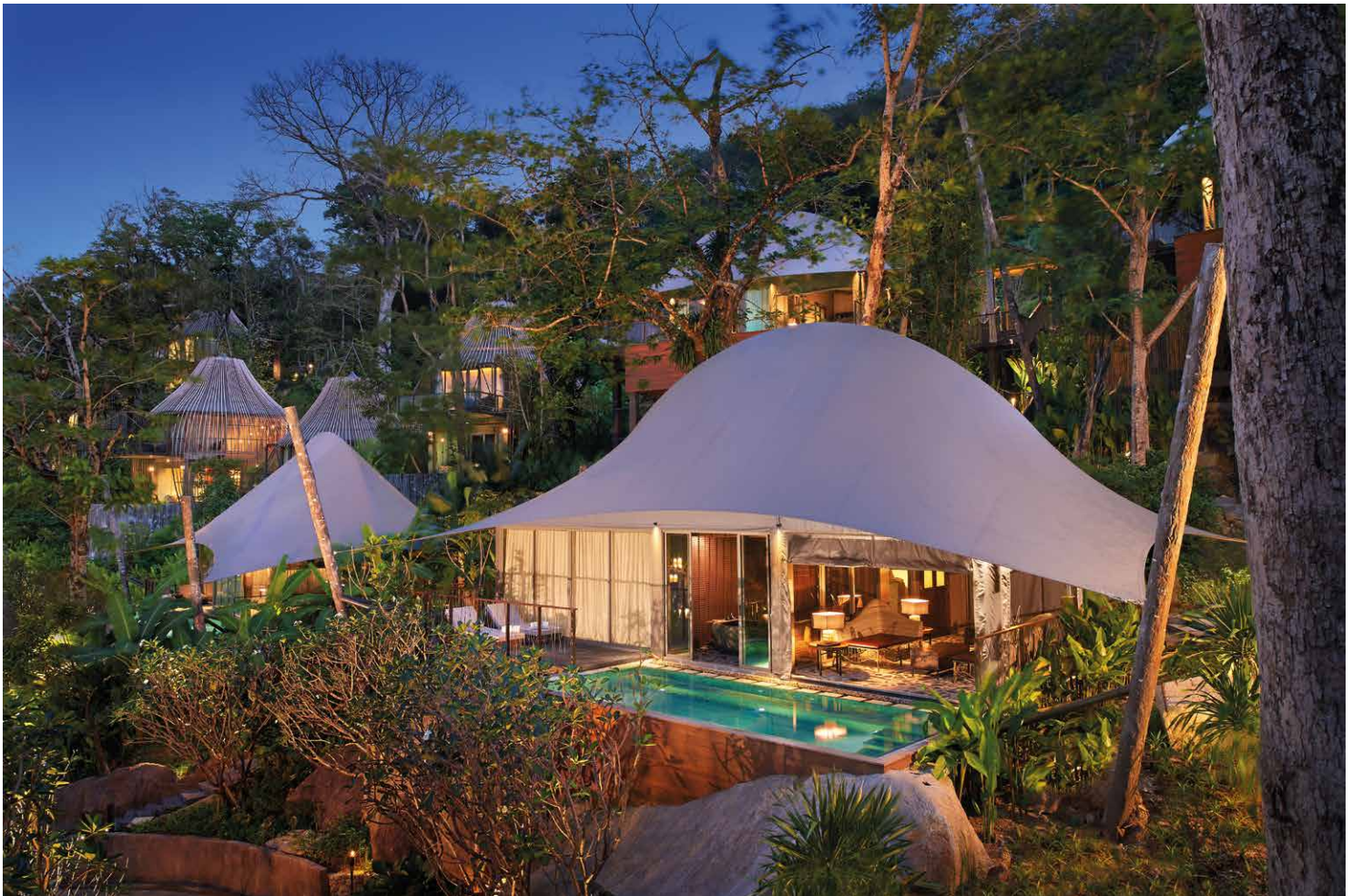
Die Zeltvillen symbolisieren den nomadischen Lebensstil des Khon-Jorn-Clans. Selbstverständlich mit eigenem Pool und liebevoll bis ins kleinste Detail eingerichtet.

Wenn es tatsächlich so etwas geben sollte, wie das sprichwörtliche „Paradies auf Erden“, dann kommt das sagenhafte „Keemala“ in Phuket, Thailand, jedenfalls extrem nah heran. Das Keemala liegt nur wenige Kilometer im bergigen Hinterland versteckt im Dschungel und entführt seine Gäste vom ersten Moment an, in dem sie die großzügige Anlage betreten in ein geheimnisvolles Paralleluniversum. Man hat fast den Eindruck, man