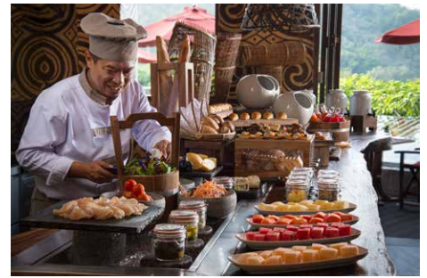
Gesund, frisch, nachhaltig - die Küche im Keemala ist Vital-Cuisine auf höchstem Niveau.

An der Westküste der Insel gelegen, kommt Keemala in den Genuss dramatischer, atemberaubender Sonnenuntergänge über dem Strand von Kamala. Erlebnisse wie diese prägen uns - vielleicht für immer.