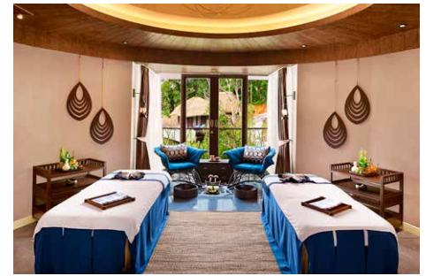
Das Mala-Spa genießt einen internationalen Ruf.

selbst als ein Kraftort des Lassens, des Rückzuges vom stressigen Alltag und ein Refugium zur Reinigung des Geistes und zur Belebung der Seele. Zu diesem Anspruch gehört natürlich auch ein exklusives Wellness- und Spa-Angebot. Das „Mala“-Spa widmet sich einem traditionellen Heilungsansatzes von Körper, Geist und Seele und verbindet dies mit modernen Verwöhn- und Schönheitsbehandlungen. Traditionelle asiatische Anwendung und ausgesuchte Antiaging-Konzepte ergänzen sich