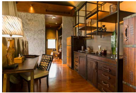
Liebevoll bis ins kleinste Detail sind alle Villen eingerichtet.